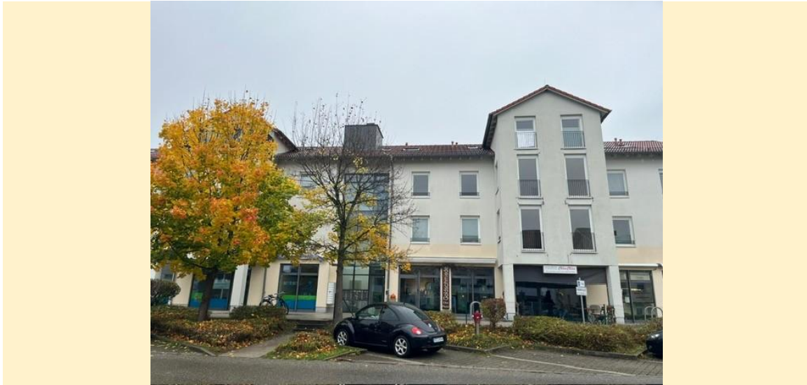
Objekt Nr. 4693